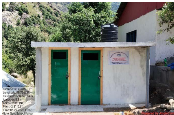
राजकीय प्राथमिक विद्यालय करूर, ग्राम सौंदर