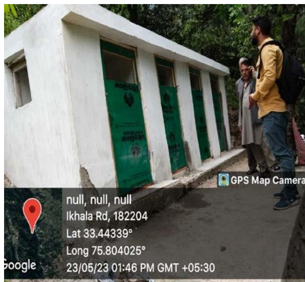
राजकीय बालिका माध्यमिक विद्यालय इखाला, ग्राम सौंदर